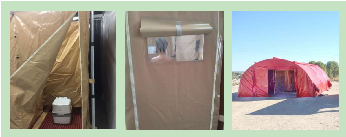
TIENDA HINCHABLE HVI (ALTA PRESIÓN)